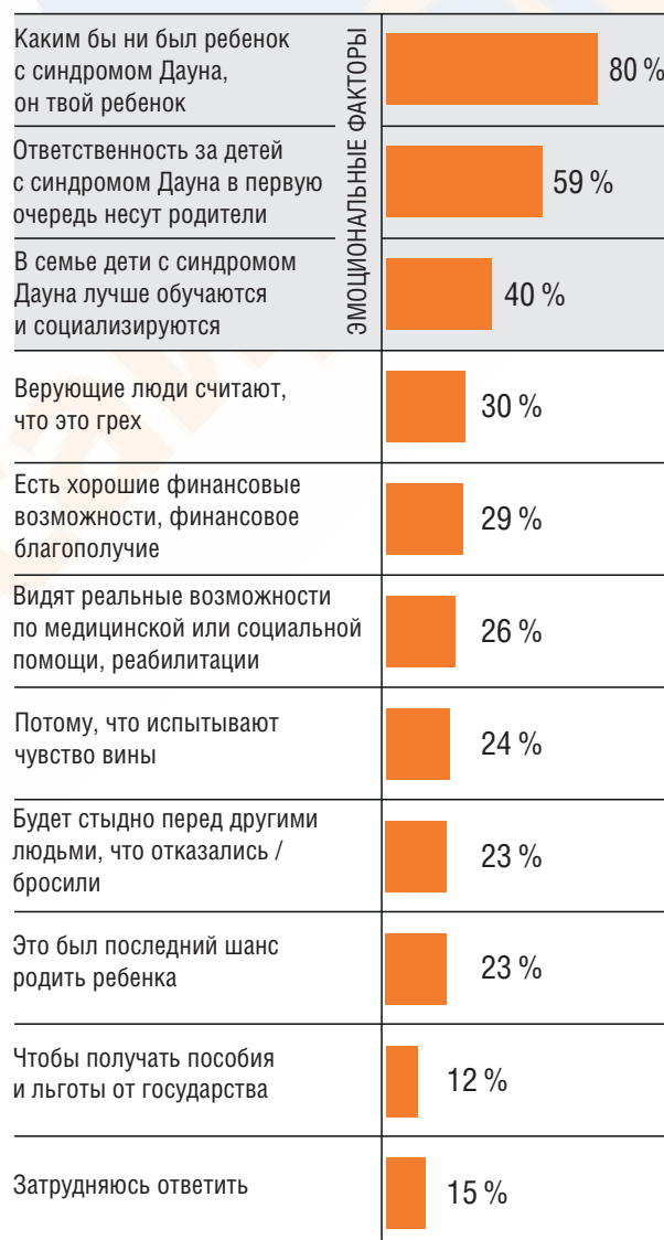
График 5. Почему ребенка с синдромом Дауна оставляют в семье

В ходе опроса была затронута и тема инклюзии детей с синдромом Дауна в образовательном пространстве. Несмотря на то, что около половины респондентов считают, что детям с синдромом Дауна лучше посещать специализированное образовательное учреждение — почти все родители готовы принимать таких